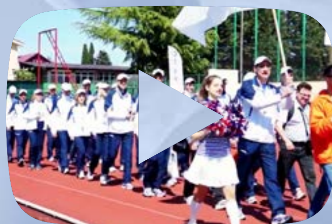
ОГК-2 В СОЧИ

https://www.youtube.com/watch?v=7L8xCK5cPPY